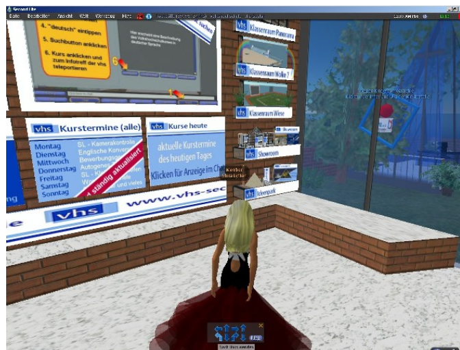
Virtuelle Präsenz der VHS Goslar

Immer mehr Universitäten nutzen Second Life, Multiverse & Co. für den Unterricht. Die Autoren des Horizon Report 2007 sehen hier einen klaren Trend: In spätestens zwei bis drei Jahren soll sich diese Entwicklung auch in anderen Bildungsbereichen durchgesetzt haben. Das ist das Ergebnis zahlreicher Interviews mit Bildungs- und Technologie-Experten sowie der Analyse von Artikeln und Forschungsarbeiten, die die Zukunft des Lehrens und Lernens thematisieren. Gebremst werden könne diese Entwicklung nach Ansicht der Autoren vor allem durch die